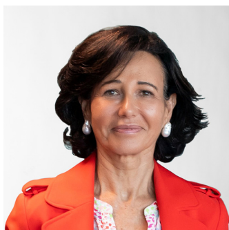
Ana Botín Presidenta ejecutiva Consejera ejecutiva