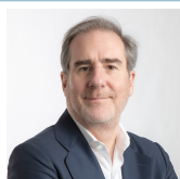
CEO Consejero ejecutivo